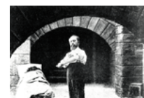
Le roman fantastique du Dr. Mercanton