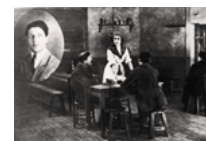
Le pauvre village