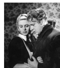
Die Frau und der Tod