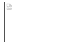
Le satyre de Bois-Gentil